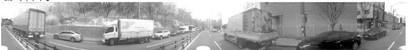
그림 1. LiDAR 근적외선 파노라마 이미지

연구에서 사용된 데이터는 실제 도로 환경에 탑재된 차량의 루프 상단에 장착된 LiDAR 센서로부터 획득된 근적외선 파노라마 이미지이다. 클래스는 실제 주행 상황에서 볼 수 있는 객체들로 차, 트럭, 버스, 자전거, 오토바이 그리고 사람이다. 이미지의 크기는 가로 1024픽셀, 세로 128픽셀으로 8:1의 종횡비를 가진다. 객체 탐지 시 목표로 설정한 최소 크기는 차량의 경우 600픽셀, 사람의 경우 400픽셀이다.