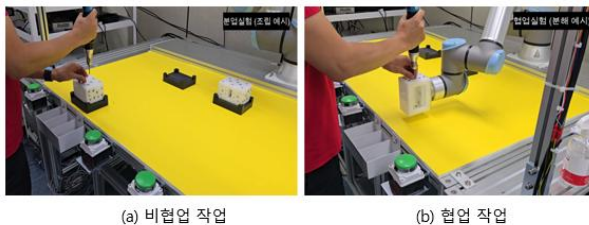
그림 3. 협업 및 비협업 비교 실험

협업 시스템이 작업자의 작업 효율성과 작업자세에 주는 영향을 검증하기 위해, 협업을 통해 나사 조립/분해 작업을 하는 경우와 작업대에 배치된 물품을 협동로봇의 협업 없이 나사 조립/분해하는 경우로 나누어서 비교 실험을 수행하였다. 그림 3 은 협업작업과 비협업 작업 실험을 나타낸다. 실험자는 협업 작업 및 비협업 작업 두가지 다 수행하였으며, 순서효과를 배제하기 위해 두 그룹으로 나누어서 협업과 비협업 시나리오 순서를 다르게 진행하였다.