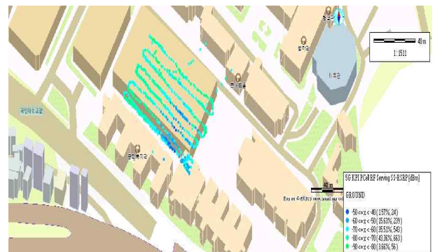
그림 2. Analyzer를 통한 신호 맵핑

수신 전력 간의 비율을 의미하며 네트워크 연결 안정성과 간섭 영향을 동시에 반영하고, NR-RSRP는 기준 신호의 평균 수신 전력으로 측정되며 단말이 인식하는 절대적인 전파 세기를 나타낸다. 수집된 데이터는 분석 이전에 정제 과정을 거쳤다. 결측 항목은 해당 변수의 평균값으로 보간되었고, 이상값은 표준화된 Z 점수를 기준으로 판단하여 Z 값이 3 이상인 항목은 통계적으로 신뢰도가 낮은 값으로 간주하여 제거하였다. 이러한