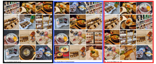
(그림 4) “탄수화물이 풍부한 음식”이라는 의미의 질의어를 한국어(좌), 영어(중), 일본어(우)로 입력한 검색 결과.