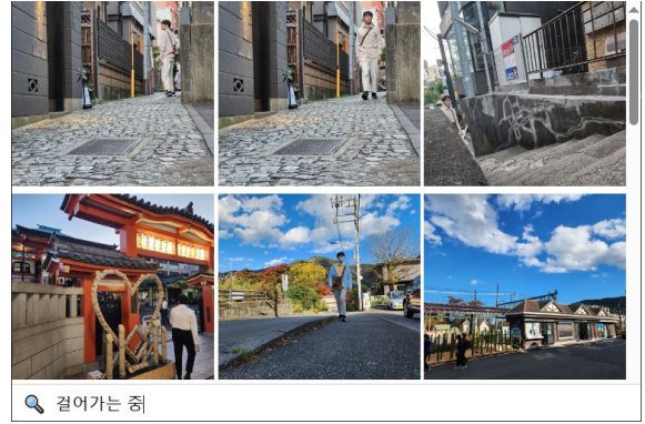
(그림 3) “걸어가는 중”이라는 행위를 묘사한 질의어에 대한 이미지 검색 결과.