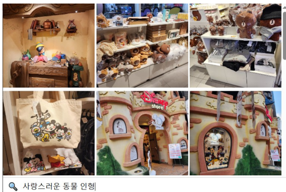
(그림 2) “사랑스러운 동물 인형”이라는 모호한 객체를 포함한 질의어에 대한 이미지 검색 결과.

이를 통해 서론에서 제기한 ‘모호한 객체 명칭·행위 중심·다국어 표현’ 같은 키워드 기반 검색의 한계를 실제로 극복할 수 있는지를 검증하고자 했다. 구체적으로는 ① 명칭이 모호한 캐릭터 상품을 질의한 경우, ② 행위를 중심으로 한 문장을 입력한 경우, ③ 한국어·영어·일본어 다국어 질의를 입력한 경우의 세 시나리오를 설정해 테스트를 진행하였다.