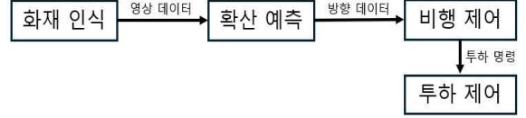
그림 4 모듈 간 데이터 흐름 및 통신 구조

본 시스템은 ROS 2의 모듈화된 구조를 활용하여, 화재 인식, 확산 예측, 자율 비행, 투하 제어 모듈이 유기적으로 연동되도록 설계되었다.