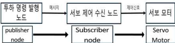
그림 3 서보 모터 제어 신호 흐름도

투하 장치는 Tarot TL2961-03 서보 모터 기반 릴리즈 모듈로 구성하였다. 서보 모터는 ROS 2 노드와 연동되어, 미션 목표점 도달 시 정밀하게 소화탄을 투하할 수 있도록 작동한다.