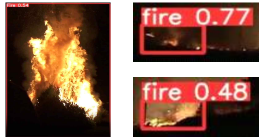
그림 1 YOLOv8 모델을 통한 산불 화재 탐지 결과 (실시간 영상 탐지)

심 좌표를 추출하여 드론과 화염 간의 상대 위치 정보를 산출하는 데 활용한다. 이를 통해 이후 화재 확산 방향 예측 및 자율 투하 경로 계산의 기초 데이터를 제공한다.