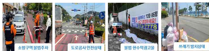
그림 3 도로 주변 불법 및 위험 요소 예시

인 3D 라이더를 사용해 이를 보완하는 방법을 제안한다[3]. 노선표시불량은 일정 주기를 가지고 카메라를 기반으로 하는 객체 인식을 통해 도로표식의 상태를 점검한다[4].