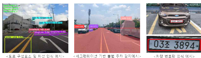
그림 4 차선, 불법주차, 번호판 인식 예시

그림 3은 도로 주변 불법 및 위험 요소의 예시다. 노선버스 또는 공공차량에 장착된 카메라는 불법 주차, 방치물, 도로공사 등 즉시 대응이 필요한 요소를 감지한다. 객체 인식과 위치 정보(GPS, 주변 건물 인식)를 결합해 관계센터로 정밀한 정보를 전송하며, 필요한 시 ITS-VMS를 통해 실시간 안내한다. 또한 차량 번호판 인식을 통해 교통법규 위반을 자동으로 추적할 수 있다.