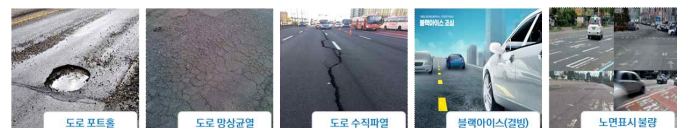
그림 2 도로 위험 요소 예시

제안하는 시스템은 노선버스를 활용한 도로 상태 분석과 도로 주변 상태 분석 그리고 관제센터를 통한 최적 대응안 도출 및 보고서 작성 기능을 가진다.