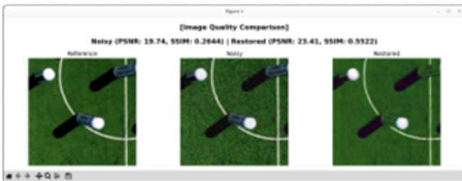
그림 3 복원 영역 이미지 품질 비교

복원은 감지된 영역에 대해서만 선택적으로 수행하며, Gaussian 노이즈 제거에 특화되어 사전 학습된 Restormer 기반 모델을 적용하였다.[4] 전체 영상이 아닌 ROI(Region of Interest) 단위로 처리함으로써, 계산 자원을 효율적으로 사용하고 불필요한 복원을 방지하였다. 복원 결과는 기준 프레임의 색상 특성과 시각적으로 일관되도록 정규화 과정을 거쳤으며, 히스토그램 분포 정렬, 프레임 기반 스무딩 등 후처리를 통해 복원된 영역과 주변 영상 간의 시각적 이질감을 최소화하였다.