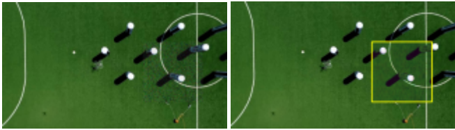
그림 2 프레임 기반 감지 및 복원 결과

본 실험은 Ubuntu 22.04 환경에서 Python 3.13.2, PyTorch 2.5.1(CUDA 12.1)을 기반으로 구현되었으며, NVIDIA GeForce RTX 4060 Laptop GPU에서 수행되었다. 입력 영상은 드론 시점에서 촬영된 960×540 해상도의 컬러 영상이며, 프레임 속도는 24fps이다. 자율주행 인지 모듈이 시각적으로 의존하는 구조물인 기둥 상단 영역에 256×256 크기의 Gaussian 노이즈( \sigma=50 )를 인위적으로 삽입하였다. 노이즈는 영상의 중간 구간(약 5초)에만 적용되었으며, 이외 구간은 정상 영상으로 유지되었다. 이를 통해 노이즈 삽입 전후의 영상 품질 변화, 그리고 제안 시스템이 노이즈 발생에 얼마나 빠르게 반응하고 복원하는지를 정량적으로 평가하였다.