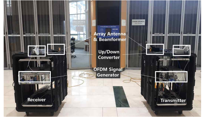
그림 1. 테스트베드 구축 환경