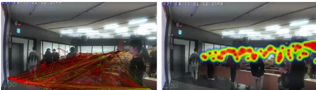
그림 2. 좌측 트래픽맵 우측 히트맵

트래픽 맵은 방문객의 이동 경로와 이동 빈도를 시각화한 것으로, 주요 이동 경로를 파악할 수 있었다. DeepSort 알고리즘을 통해 보다 정확한 객체 추적이 가능하여 고객의 공간 내 이동 패턴을 명확히 분석하고 효율적인 공간 배치 및 동선 관리 전략 수립에 활용할 수 있었다.