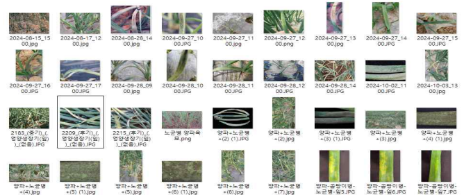
그림 1. 양파 병해 이미지 데이터셋

우선 본 연구를 진행하기 위한 데이터셋 구성을 진행하였으며, 각각 정상 양파 이미지와 병해 양파 이미지를 수집하였다.