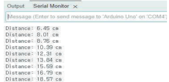
그림 3. 초음파 감지 센서에 감지된 물체의 거리

그림 2의 각 그림은 초음파 감지 센서를 통해 감지된 물체의 거리에 따른 LED 표시를 나타낸 것이다. 첫 번째 그림은 물체가 30cm 이내에 감지되어 빨간색 LED가 켜진 상태이다. 두 번째 그림은 물체가 50cm 이내에 감지되어 노란색 LED가 켜진 상태이다. 세 번째 그림은 물체가 70cm 이내에 감지되어 초록색 LED가 켜진 상태이다.