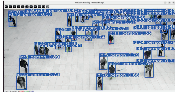
그림 6 객체 검출 및 추적 시각화 결과

[ID, (x1, y1, x2, y2), confidence] 형식으로 로그에 저장되었으며, Open Source Computer Vision(OpenCV)의 cv2.imshow() 함수를 이용해 Bounding Box와 ID 정보를 실시간으로 시각화할 수 있도록 하였다. [3] 그림 6은 다수의 사람이 존재하는 영상에서, YOLO v8과 SORT 알고리즘이 각 인물에게 고유 ID를 부여하고 추적하는 과정을 시각화한 결과이다.