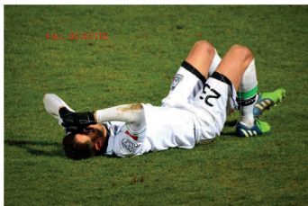
그림 5 Pose 기반 사용자 이상 자세 판단 시각화

안심키가 서비스를 수행 중인 드론은 사용자의 위급 상황을 실시간으로 감지하기 위해, 신체 자세 분석 기반의 쓰러짐 탐지 기능과 사용자 미감지 시 비상 알람 기능을 주요 기능으로 포함하도록 설계되었다. 탐지된 사람 객체 영역에 대해, 파이썬의 MediaPipe 라이브러리를 이용하여 자세 추정을 수행하며, 어깨와 엉덩이 중심을 잇는 선의 기울기나 코의 상대적 위치 등을 분석하여 사용자의 쓰러짐 여부를 판단한다. [2] 특히 어깨와 엉덩이 중심선의 기울기가 30도 미만이거나, 코가 양 무릎보다 아래에 위치할 경우 사용자가 쓰러진 것으로 간주한다. 그림 5는 Media Pipe 기반 자세 분석을 수행한 예시로, 어깨-엉덩이 선의 기울기가 30도 미만으로 계산되어 ‘쓰러짐’으로 판단한 상황을 시각적으로 나타낸다. 사용자가 쓰러진 것으로 판단되거나, 사용자가 5초에서 10초 동안 갑자기 감지되지 않는 등 위급 상황이 발생했다고 판단될 경우, 사전에 등록된 보호자 및 경찰에 신고하는 등의 대응을 하도록 설계된다.