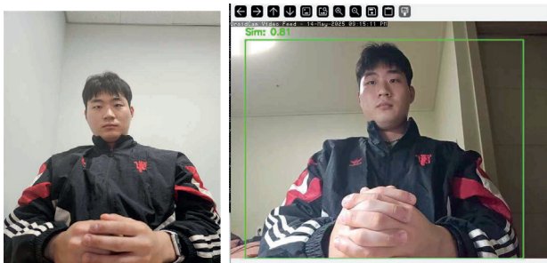
그림 3 사용자 이미지 예시 그림 4 실시간 인식 및 유사도 판단 결과

한다. 상반신 등록은 카메라에 사용자가 미리 촬영한 정적 이미지를 제공한다. 그림 3은 이러한 상반신 등록 과정에서 사용되는 사용자 정적 이미지의 예시를 나타낸다. 등록된 이미지는 CLIP 모델을 사용하여 임베딩 벡터로 변환된다. 이후 드론의 카메라가 촬영하는 실시간 영상에서 YOLO v8 모델을 활용하여 사람을 탐지하고, 탐지된 각 인물에 대해 CLIP 임베딩을 생성한다. 이를 등록된 기준 임베딩과 비교하여 코사인 유사도(Cosine Similarity)를 계산한다. 그림 4는 드론이 촬영한 영상에서 탐지된 인물에 대해 CLIP 임베딩을 적용하고, 기준 이미지와의 유사도를 측정 한 결과이다. 유사도 값이 설정된 임계값 이상일 경우, 해당 인물을 등록된 사용자로 식별한다. 일반적으로 코사인 유사도는 -1.0에서 1.0 사이의 값을 가지며, 값이 0.4 이상일 경우 두 이미지가 시각적으로 유사한 것으로 판단된다. [1] 본 시스템에서는 보다 엄격한 사용자 식별을 위해 임계값을 0.7로 설정하였다.