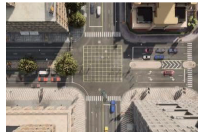
그림 3. CARLA 시뮬레이터 Top-Down-View 이미지

본 연구에서는 Bench2Drive 프로젝트에서 제공하는 nuScenes 포맷 레퍼런스를 활용하여, 중앙 집중형 자율주행 모델 학습을 위한 데이터셋을 구성한다[2]. 특히 그림 3 과 같이 CARLA 시뮬레이터에서 실제 도로 인프라에서 획득 가능한 Top-Down-View 카메라 이미지를 취득하고, 이를 nuScenes 기반 어노테이션과 결합함으로써 새로운 데이터 파이프라인을 구축한다.