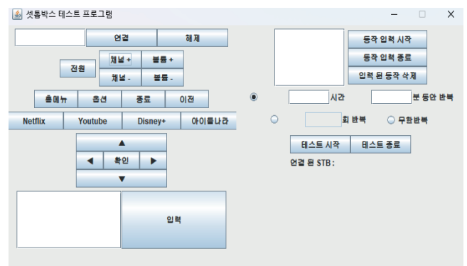
그림 1. 셋톱박스 테스트를 위한 UI 구성

안드로이드 기반의 셋톱박스를 에이징 테스트 하기위한 셋톱박스 UI 구성은 다음 그림 1에서 확인할 수 있다. 테스트 시작과 종료를 제어하는 버튼과 채널과 볼륨 그리고 스트리밍 서비스 메뉴를 포함해 시간 및 분 단위로 테스트를 설정하게 구성했다. 아울러 에이징 테스트로써, 반복 회수와 무한반복 옵션을 통해 장시간 테스트를 반복하도록 설정하도록 설계되었다.