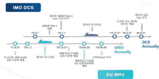
[그림 1] IMO DCS 및 EU MRV 규제 Timeline

국제해사기구(IMO)와 유럽연합(EU)의 선박 데이터 수집·보고 체계는 점차 강화되고 있으며, 특히 2025년 이후에는 CII (탄소집약도 지표) 등 에너지 효율 정보를 실시간으로 수집·보고하는 체계가 요구될 전망이다. 이러한 흐름 속에서 자율운항선박은 운항 자동화와 안전성 제고를 위해 고신뢰 실시간 데이터 수집이 필수적이다. 그림 1은 이러한 국제 규제 변화 흐름을 시계열로 보여준다.