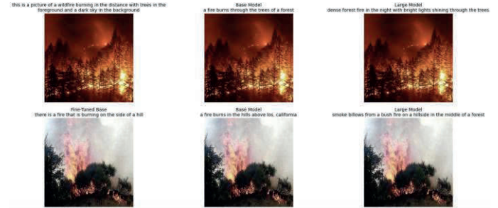
[그림 4] Ours, Base, Large 모델의 캡서닝 결과 비교

마지막으로, 결과물을 정성적으로 분석한 결과, 생성된 캡션은 시각적 장면을 자연스럽게 일관성 있게 기술하고 있어, 인간 관점에서도 충분히 수용 가능한 수준의 품질을 보였다.