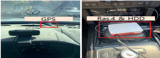
그림 2. 사용자 위치 이력 수집 장치

본 절에서는 제시하는 LSTM 기반 사용자 위치 학습 파이프라인 구조를 실증하고 실제 개인 위치 데이터를 기반으로 실험하였다.