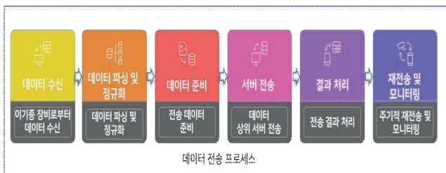
그림 2. Storage/Application Layer 데이터 전송 프로세스 Fig 2. Storage/Application Layer Data Transfer Process

마지막 네 번째 계층인 Storage/Application Layer에서는 정규화된 데이터를 상위 분석 플랫폼으로 실시간 송신할 수 있도록 그림 2와 같이 시스템을 구성하였다. 데이터 전송은 MQTT(Message Queuing Telemetry Transport) 프로토콜과 HTTP REST API 방식을 병행하여 지원하였다.