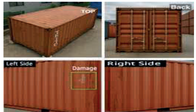
그림 3. 수집 이미지 데이터

본 연구에서는 항만 컨테이너의 검수 자동화를 위해 드론 기반 촬영 시스템과 Jetson Nano 연산 모듈을 활용한 실시간 영상 분석 기법을 제안하고, 그 유효성을 시뮬레이션 환경에서 검증하였다. 본 시스템은 Pixhawk 기반 자율 비행을 통해 컨테이너를 정면, 후면, 좌측, 우측, 상부 방향에서 촬영하고, 수신된 영상 프레임에 대해 RCNN 기반 손상 탐지, YOLO 기반 자물쇠 탐지, CRNN+OCR 기반 일련번호 인식을 순차적으로 수행한다.