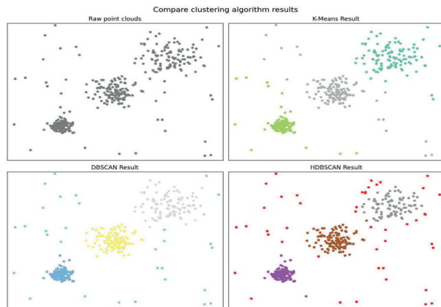
그림 3 클러스터링 결과 비교 시각화

그림 3은 전처리된 포인트 클라우드에 대해 세 가지 클러스터링 알고리즘을 적용한 결과를 비교한 것이다. 각 그래프는 다음과 같은 특징을 보인다.