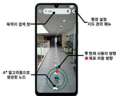
[그림 1] WIGO 사용자 인터페이스(UI)

Text-to-Speech (TTS) 기능은 Google의 TTS API를 기반으로 구현되었으며, 사용자의 이동에 따른 이벤트에 따라 음성 안내를 제공한다. 이러한 음성 기반 인터페이스는 화면 조작이 어려운 사용자도 손쉽게 실내 내비게이션 기능을 활용할 수 있도록 지원하며, 접근성과 편의성 모두를 향상시키는 핵심 요소로 작용한다.