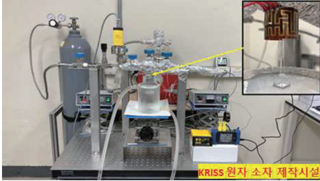
그림 2. KRISS 원자 소자 제작 시설

요한 원자 소자 제작 지원 등이 추진되고 있다. 그림 2는 양자 센서에 필요한 핵심 소자인 원자 증기셀 제작 시설로 국내 산학연에 신규로 지원할 예정이며 관련 컨설팅 및 제작을 지원하고 이를 통해 국내 양자 센서 인프라 관련 업체의 기술 향상을 도모할 예정이다 [4]. 장기적으로는 이를 기반으로 양자 센서 및 통신에 필요한 외부 수요에 대응하고 관련 인프라를 지속적으로 확충할 계획이다.