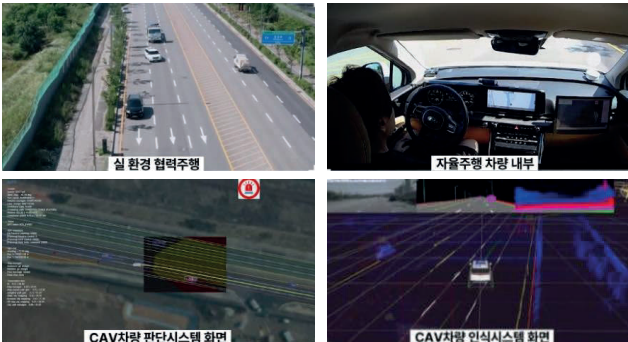
그림 3. V2V 통신을 이용한 자율주행 실험 전경 및 시스템 화면

V2V 통신 기술을 활용하면, 차량 간 주행 의도에 따른 협상을 통해 혼잡한 주행 상황에서도 안전한 자율주행이 가능하다. 본 연구에서는 V2V 기반 자율주행 실험을 위해 자율주행차에 OBU 를 탑재하고, 협상 대상인 커넥티드 차량에는 OBU 와 주행 협상 입력용 단말기를 구성하였다. 실험 시나리오는 차선 변경, 저속 차량 추월, 긴급 차량 양보의 세 가지로 구성되며, 모든 실험에서 차량의 위치 정보를 포함한 BSM(Basic Safety Message)을 주기적으로 송수신한다. 차선 변경 실험에서는 자율주행차가 끼어들기 시 DMM(Driving Maneuver Message)을 전송하고, 이를 수신한 커넥티드 차량은 단말을 통해 이를 확인하고 감속 등의 대응을 수행한다. 저속 차량 추월 실험에서는 자율주행차가 DNM(Driving Negotiation Message)을 통해 추월 의도를 전달하고, 커넥티드 차량의 승인을 받은 뒤 추월을 수행하며 완료 메시지를 전송한다. 긴급 차량 양보 실험에서는 EDM(Emergency Driving Message)을 수신한 자율주행차가 교차로나 합류로 등에서 우선 주행 차량에 양보하도록 동작한다. 이와 같은 시나리오를 통해, V2V 통신 기반의 주행 협상 기법이 자율주행 전략의 고도화에 기여 할 수 있다.