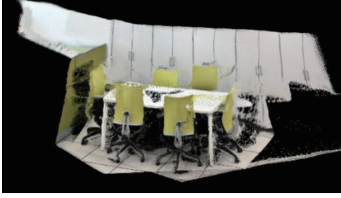
(c)3D Gaussian 장면 재구성 결과 화면