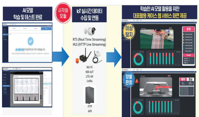
[그림 2] AI 프레임워크 시각화(모니터링) 모듈

위에서 설계한 기능의 적용을 통해 AI 프레임워크 시각화 모듈을 구현했으며, 1단계 연동에선 실제 RTS(Real Time Streaming), HLS(HTTP Live Streaming) 연동 기능을 통하여, 정상 연동 여부를 테스트 및 점검할 수 있는 기능을 제공한다. 2단계 세부 설정에서는 1단계 때 제공된 정상 연동 테스트 및 점검 기능과 더불어, 신규 생성하는 추론 세션의 서비스 명 설정, 추론 수행 주기 및 분할 프레임 수 설정, 적용 AI 모델 설정 등 서비스를 세부적으로 설정할 수 있는 기능을 제공한다. 적용 모델에는 앞서 소개한 AI 프레임워크의 AI 학습 모듈[3]을 통해 실제 학습 완료된 모델을 적용 가능하다. 마지막으로 3단계 서비스 등록 단계에선 1, 2 단계에서 설정한 설정 내용(IoT Gateway IP, 서비스 프로젝트 명, 서비스 명, 분할 프레임 설정, 적용 모델 설정, 관심 라벨(Class) 설정, 서비스 프로젝트, AI 모델)을 한눈에 확인하여 최종적으로 추론(Detect) 세션을 생성할 수 있다. 이때 생성되는 추론 세션은 컴퓨팅 자원이 가장 많이 지속적으로 요구되는 부분으로 효율성을 고려하여 따로 복잡한 과정 없이 서비스 설정 내 지정한 파라미터 값을 그대로 받아 리소스가 할당된 가상 환경내에서 추론(Detect) 스크립트 자체로 돌아갈 수 있도록 단순화 방안을 적용하였다.