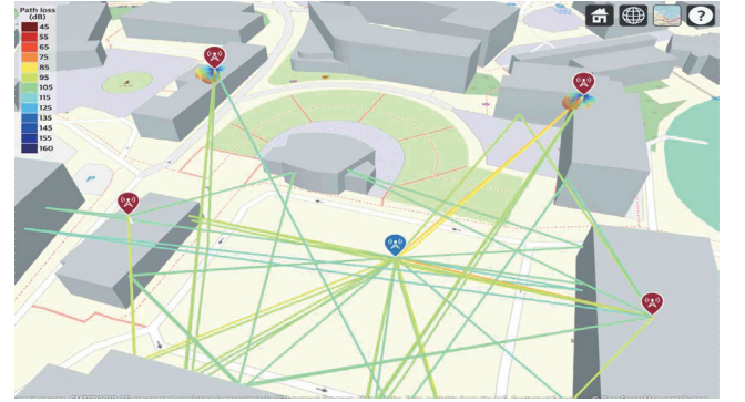
그림 1. MATLAB ray-tracing을 통한 beam RSRP 측정 환경

최근 수신 신호의 측정값을 기반으로 생성된 데이터베이스를 통하여 사용자의 위치를 추정하는 핑거프린트 기법이 실내 및 실외 환경 측위에서 폭넓게 사용되고 있다 [1]. 그 중, beam RSRP(reference signal received power)는 BS(base station)와 UE(user equipment) 사이의 환경적 요소를 내포하고 있어 무선 신호 기반 측위에서의 측정값으로 주로 활용된다 [2]. 그러나 이러한 데이터베이스 구축은 많은 시간과 인력 자원을 요구하기 때문에, 최근에는 실제 환경을 정밀하게 모사할 수 있는 ray-tracing 기법이 측위 알고리즘의 사전 검증 단계에서 효과적인 대안으로 활용되고 있다. 따라서 본 논문에서는 MATLAB Ray-tracing으로 생성된 beam RSRP 데이터를 활용하여 그래프 신경망 기반의 측위 성능을 분석하였다.