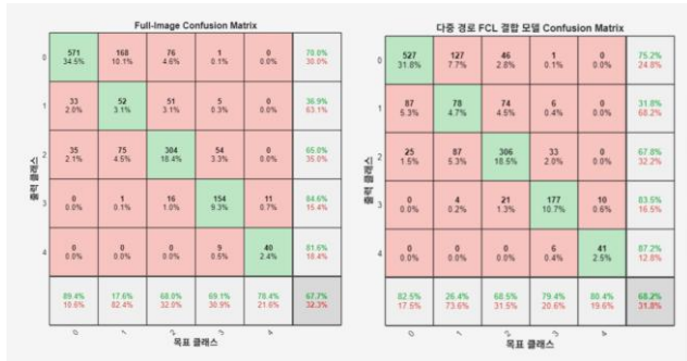
그림 2. 기준 모델(좌)과 제안 모델(우)의 혼동 행렬 비교

다음으로, 5 개 ROI 특징을 모두 사용하는 다중 경로 융합 모델(제안 모델)과 전체 이미지 모델(기준 모델)의 성능을 비교하였다. 그림 2 는 두 모델의 혼동 행렬을 보여준다. 기준 모델의 최종 정확도는 67.7%였으며, 제안 모델의 정확도는 68.2%로, 두 모델 간 성능에 통계적으로 유의미한 차이는 나타나지 않았다. 두 모델 모두 KL 등급 1 과 2 를 혼동하는 유사한 오류 패턴을 보였으며, 이는 해당 등급 간의 미세한 차이를 구분하는데 어려움이 있음을 의미한다.