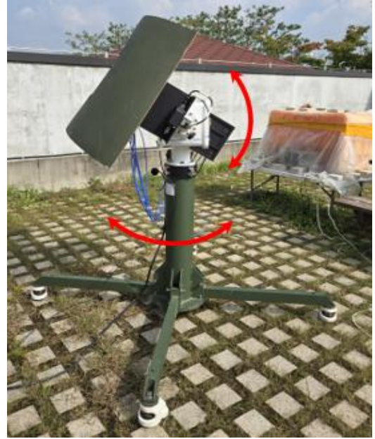
Figure 2 자세변화에 의한 MSAS 위성 가시성 시험

시험 결과는 2장에서 유도한 식의 결과와 동일하게 137번 위성의 방위각 을 중심으로 \pm 50 도에서 고각 40도일 때 위성 신호를 수신할 수 있었다. 다만, 3축 회전장비를 적용할 수 없는 한계에 의해 비록 \phi 가 영으로 고정 된 시험이었으나, \phi 가 가변인 경우는 2장의 해석 식에서 동등한 고각으로 변환하여 결과를 확인할 수 있다.