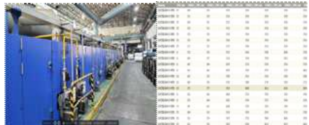
그림 1. 텐터기 및 데이터 모니터링 시스템 일부

챔버부, 챔버의 열을 배출하고 새로운 공기를 제공하는 덕트부, 공기를 정화하여 배출시키는 집진기로 구성된다. 본 연구에서는 챔버부의 내부 좌우에 대한 16개의 온도정보, 챔버내의 열풍기 모터 RPM 정보 8개, 챔버내 습도 정보 2개, 덕트부의 공기 배기팬 모터 RPM 정보 2개, 원단을 챔버내로 이동시키는 컨베이어벨트 속도 정보 1개, 텐터기 순시전력 정보 확보를 위한 전력량계 1개 등 30종의 데이터를 확보하였다[2]. 데이터 모니터링 시스템은 나이가라 프레임워크를 기반으로 1분 주기로 데이터를 저장하였으며, PySR기반의 심볼릭회귀기법에는 이상치를 제거한 3개월 데이터를 사용하였다. 그림 1은 실험에 사용된 텐터기의 모습과 기 개발된 데이터 모니터링의 데이터 수집 과정이다.