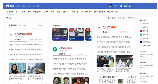
그림 1. 크롤링의 바탕이 되는 웹 사이트 예

a 프로그램을 호출하고, 이 과정에서 기사 제목의 중복 제거 및 번호 매기와 같은 포매팅 작업이 수행된다. 이러한 구조는 단일 언어 프로젝트보다 복잡하지만, 언어 간 상호 운용성과 프로세스 간 통신에 대한 이해를 심화할 수 있다는 학습적 의미가 크다. 또한 윈도우즈와 유닉스 계열 환경 모두에서 실행 가능하도록 exe 및 ELF (Executable and Linkable Format) 바이너리, Java 바이트코드로 자동 변환되어 크로스 플랫폼 호환성을 제공한다.