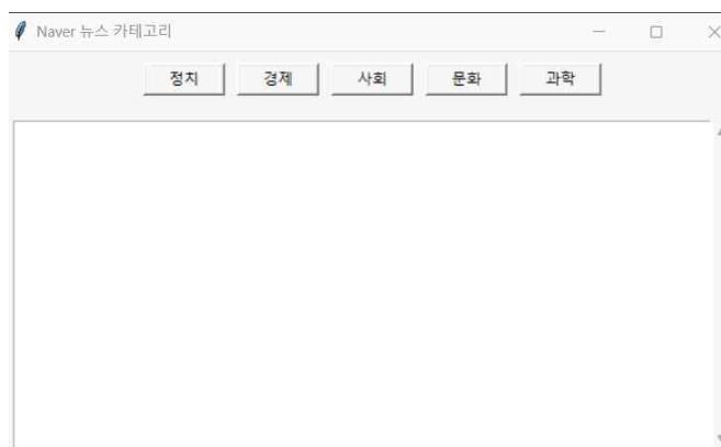
그림 2. 구현 프로그램 메인화면

사용자 인터페이스는 Python의 표준 GUI 라이브러리인 Tkinter를 활용하여 구현하였다. 그림 2와 같이 본 시스템은 직관적인 그래픽 사용자 인터페이스(GUI) 모드를 제공하며, 사용자는 화면에 표시된 다섯 개의 버튼(정치, 경제, 사회, 문화, 과학) 중 하나를 클릭하여 원하는 뉴스 카테고리를 선택할 수 있다. 버튼 클릭 시 해당 카테고리에 대응하는 네이버 뉴스 섹션에서 HTML 데이터를 수집하고, 상위 5개의 기사 제목을 추출하여 출력창에 실시간으로 표시한다. 그 예시는 그림 3과 같다. 결과는 스크롤 가능한 텍스트 영역을 통해 제공되며, 제목 앞에는 자동으로 번호가 부여되고 중복 기사나 불필요한 문구는 제거된다. 이러한 구조를 통해 사용자는 명령어 입력 없이 클릭 한 번으로 최신 뉴스를 확인할 수 있으며, 단순하고 응답성이 빠른 인터페이스를 구현하였다. 또한 GUI 환경이 지원되지 않는 시스템에서도 동일한 기능을 수행할 수 있도록 CLI(Command Line Interface) 모드를 병행 제공하였다. 두 인터페이스는 모두 동일한 백엔드 로직을 공유하여 코드의 일관성을 유지한다. 이를 통해 유지보수성과 확장성을 높였으며, 실제 실행 환경에 따라 자동으로 GUI 또는 CLI 모드가 선택되도록 설계하였다. 결과적으로, 본 구현은 단순한 크롤링 기능을 넘어 사용자 중심의 접근성과 실용성을 강화한 프로그램의 형태로 발전하였다.