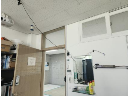
그림 3. 실제 실험 환경

구현된 시스템의 성능을 검증하기 위해 그림 3 과 같이 실제 실내 공간에 구현하여 실험을 수행하였다.