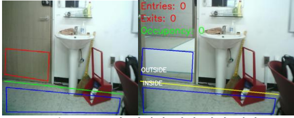
그림 2. ROI 및 경계선 설정 방식 예시

분석하여 입장 또는 퇴장으로 판별하고 그 차이로부터 실내에 잔류하는 인원의 수를 추정한다.