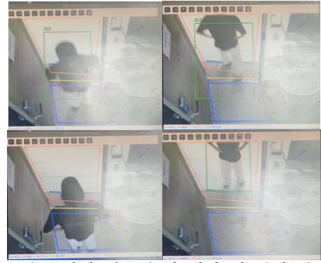
그림 4. 검증 당시 시스템 상 입장 및 퇴장 판별 과정

실험은 반복적인 입장과 퇴장 시나리오로 진행되었으며 카메라는 그림 4 와 같이 입장 또는 퇴장으로 판별하였다. 이후 mmWave 센서가 반환하는 값을 함께 반영하여 최종 인원 수 추정 결과를 도출하였다.