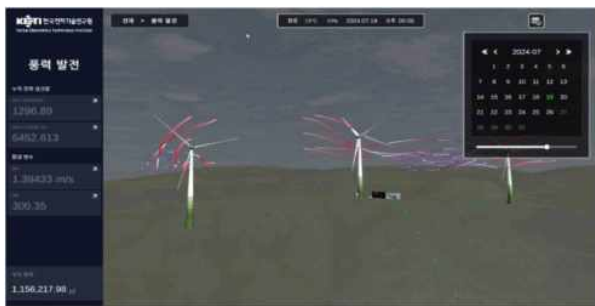
그림 3 3차원 공간정보기반 통합 시스템

본 논문에서는 3차원 공간정보기반 통합 시뮬레이션 환경을 구축하여 기존 연구들이 개별 패널이나 터빈의 성능 모니터링에 집중했던 한계를 극복하고, 3D GIS기반의 통합된 공간정보환경에서 풍력과 태양광을 동시에 관리할 수 있는 포괄적 시스템을 구현하였다. 또한, 실시간 이미지와 전산 해석 데이터의 융합을 통해 기존 수치 데이터 모델링과는 대조적으로, 결합모델링을 이용하여 구름의 실시간 변화와 바람의 3차원 특성을 고려한 예측 모델을 개발하였다.