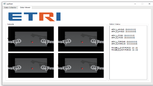
그림 2. 로봇 동작 데이터 예시

Action 구조로 변환되며, Observation 은 시점 t 의 이미지와 관절 각도, Action 은 이후 100 스텝의 관절 변화와 패딩 플래그로 구성된다. 이 구조는 시간적 연속성을 반영한 정밀 조작 학습에 적합한 고충실도(high-fidelity) 데이터셋을 제공한다.