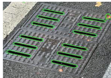
그림 1 상하수도 시설물 구멍 필터링

이후, SAM을 활용해 이미지 내 모든 다양한 물체로 분할 했고 구멍을 필터링 하기 위해 면적 및 종류, 중횡비를 기준으로 필터링 했다.