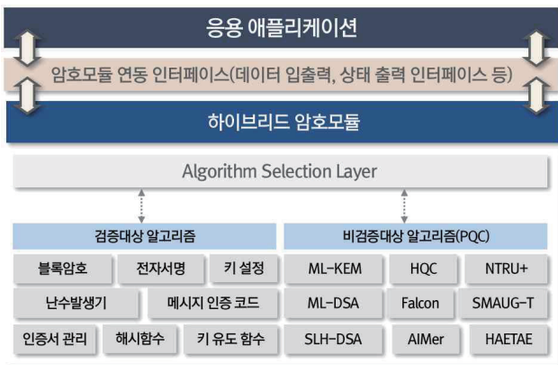
그림 2. 하이브리드 암호모듈 아키텍처

제안하는 하이브리드 암호모듈은 KCMVP 검증 대상 알고리즘(ARIA, LEA, ECDSA 등)과 PQC 알고리즘(ML-KEM, ML-DSA 등)을 동시에 지원하는 구조를 갖는다. 현재 운영 단계에서는 KCMVP 검증 대상 알고리즘을 우선 적용하여 제도적 요구사항을 충족하고, 동시에 표준을 만족하는 PQC 알고리즘을 병행 지원하여 향후 PQC 알고리즘이 검증 대상 암호 알고리즘으로 등재되었을 경우 즉시 적용 가능하도록 구현되었다. 이를 통해 양자 위협에 대한 점진적인 보호를 제공한다.