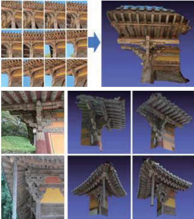
그림 1. 영상기반 공포 영역 3D 복원 결과

우선, 3차원 복원 실험에서는 수덕사 대웅전, 봉정사 극락전 등 대표적인 전통 건축물의 공포 부재 영역들을 촬영하여 입력 영상으로 활용하였다. 각 건축물별로 약 12 ~ 18장의 영상을 사용하였으며, 이를 바탕으로 SfM 기법으로 회소 점군을 추출하고, MVS 기법으로 고밀도 점군을 생성하였다. 그림1 과 같이 결과적으로 복원된 공포 모델은 단순한 사진에서는 확인하기 어려운 구조적 세부 요소까지 정밀하게 재현할 수 있었다. 예를 들어, 곡선부의 결구 방식이나 내부 맞춤부와 같은 디테일이 3D 메쉬로 뚜렷하게 표현되었으며, 이는 공포의 전통적 건축 기법을 분석하는 데 중요한 근거를 제공하였다. 다만, 일부 단순한 평면 구조를 가진 사례에서는 특징점 추출이 불완전하여 벽체 인접 영역에 데이터 결손이 발생하는 한계도 확인 되었다.