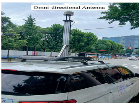
그림 1. 이동형 측정 장비 구축 및 실 환경 측정(외부)

인접대역 잡음전력 측정을 위해 그림 1 및 2와 같이 이동형 차량에 실외(외부) 광대역 안테나 및 GPS 안테나 등을 설치하였다. 차량 실내(내부)에는 잡음(Noise)과 RF 신호 등의 스펙트럼 모니터링(RF Spectrum Monitoring)을 위해 광대역 분석기를 이용하였고, ETRI에서 보유하고 있는 측정 데이터 신호 전력 수준 및 도심지 경로 확인을 위한 측정(Measurement) S/W를 활용하였다. 측정 S/W는 광대역 분석기와 연동 및 관련 스펙트럼 정보를 측정 데이터와 함께 저장할 수 있는 장점을 가지고 있다. 이를 이용해 국내 Dense Urban(서울) 및 Urban(송도, 광주, 대구, 부산 등) 환경에 대한 측정 데이터를 확보하였으며, 전파잡음 특성 분석을 수행하였다. 그림3의 결과는 하나의 사례이지만, 해당 대역에서 Dense Urban 환경이 Urban 환경보다 상대적으로 더 많은 잡음 전력을 나타내고 있음을 보여준다.