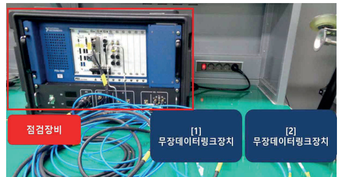
그림 2 다중 점검 시스템 시험 환경 구성

그림 2는 제안하는 다중 점검 시스템을 기반으로 한 시험 환경 구성이다. 사용자가 2개의 무장데이터링크장치를 점검장비에 결합한 후 통합 제어 소프트웨어를 통해 시험을 시작한다. 이후 순차적으로 무장데이터링크장치에 전원을 공급하고, 통신을 시작하여 송수신 성능 측정을 자동으로 수행한다. 시험 결과, 제안하는 방식은 시제 교체에 소요되던 물리적 시간과 상주 인력의 불필요한 대기 시간을 제거함으로써 전체 공정의 시간 및 인력 소모를 약 52% 개선하였다.