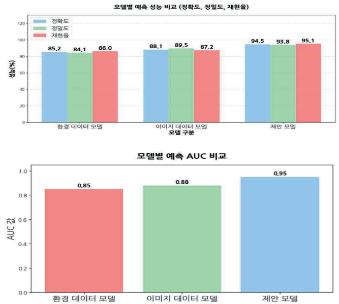
그림 2. 모델 성능 비교 그래프