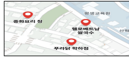
그림 3 음식점 마커

지도상에서 식당의 위치를 쉽게 파악하기 위해 [그림 3]과 같이 마커 기능을 활용했다. 각 음식점 마커는 눈에 띄는 디자인의 UI 스타일을 적용한다.