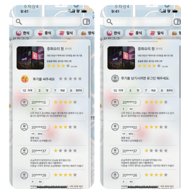
그림 4-1. 인증 후 화면 그림 4-2. 인증 전 화면

지도상에서 식당의 위치를 쉽게 파악하기 위해 [그림 3]과 같이 마커 기능을 활용했다. 각 음식점 마커는 눈에 띄는 디자인의 UI 스타일을 적용한다.