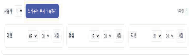
그림 2. 기본 웹 구성 - 사용자 ID별 브라우저 푸시 구독

있도록 구성하였다. 이를 통해 사용자는 지정된 시간에 맞춰 알림을 받을 수 있으며, 시스템은 설정된 정보를 기반으로 푸시 알림 기능을 자동으로 활성화하였다.[2]