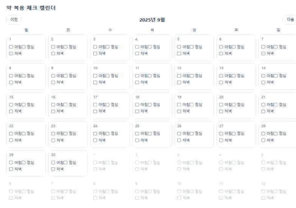
그림 3. 기본 웹 구성 - 사용자 (환자) 약 복용 체크 캘린더

그림 3은 사용자가 약을 복용한 후 복용 확인 버튼을 클릭했을 때, 복용 기록을 시각적으로 한눈에 확인할 수 있도록 체크 표시가 나타나는 캘린더 UI를 구현한 결과를 보여준다. 사용자가 기본 웹 페이지에 접속하면, 해당 날짜에 맞는 캘린더가 자동으로 표시되도록 설정하였다. 사용자가 시스템을 이용하는 날짜와 시간에 따라 당일 기준의 캘린더가 활성화되도록 구현하였다. 또한 현재 월과 다음 월을 색상으로 구분하여, 월별 구분이 명확하고 시각적으로 직관적으로 인식될 수 있도록 설계하였다. 이를 통해 사용자는 복용 현황을 보다 쉽게 파악할 수 있다.