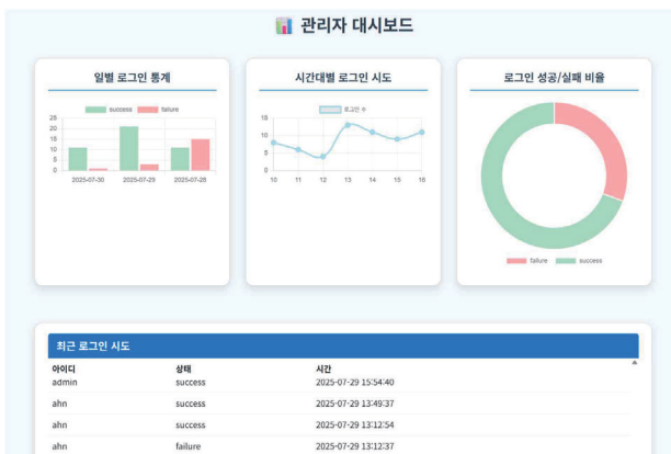
그림 4. 관리자 모니터링 화면

네트워크 경계 보호를 위해서는 Tailscale 기반 VPN을 적용하였다. Tailscale은 WireGuard 프로토콜 기반의 경량 VPN 솔루션으로, 포트 포워딩 없이 안전한 원격 접속이 가능하도록 하며, 외부 접근을 VPN 인증 및 암호화를 통해 제한한다.