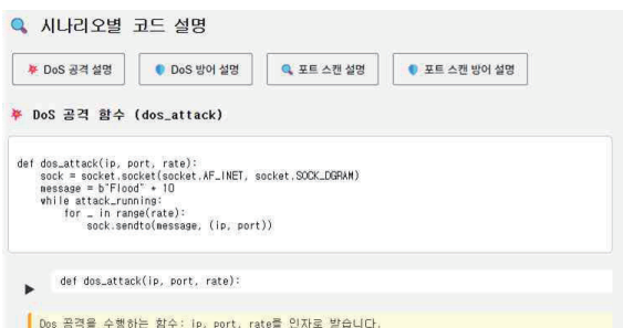
그림 3. 코드 추가 설명 화면

[그림 3]은 DoS 공격 시나리오에서 사용된 dos_attack 함수의 실행 코드