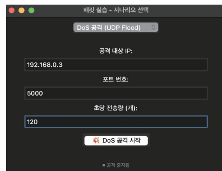
그림 1. 공격 예시 화면

[그림 1]은 사용자가 클라이언트 측 GUI에서 DoS 공격(UDP Flood) 시나리오를 선택하고, 공격 대상 IP, 포트 번호, 초당 전송량을 직접 입력한 후 공격을 실행하는 화면이다. 해당 GUI는 tkinter 기반으로 구현되었으며, 시나리오 실행 시 사용자의 설정에 따라 실시간으로 UDP 패킷을 생성하여 전송한다.