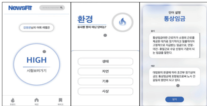
그림 3. 어휘력 테스트 / 단어 정의 및 예문

[그림2]는 본 시스템의 구성을 나타낸다. 빅인즈로부터 매일 5건 이상 수집한 뉴스를 기반으로 GPT-4o를 사용하여 데이터를 생성하고, 검수를 통하여 데이터베이스에 저장한다. 백엔드 API 서버는 Spring Boot 기반으로 구축되었으며, 사용자 인터페이스(UI)는 React 프레임워크를 통해 제공한다. 전체 시스템의 배포 및 운영은 Cloudflare를 기반으로 수행한다.