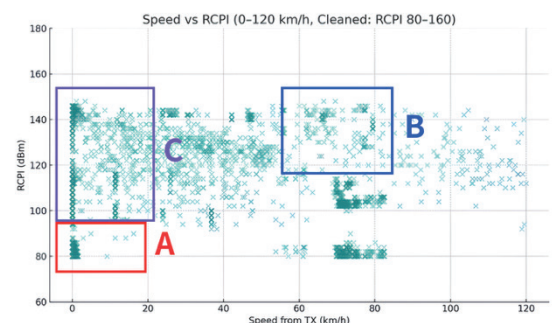
그림 1. 속도-RCPI 산점도 (80≤RCPI≤160)

실도로 로그에는 정차·반사·차폐 등 환경 요인으로 인한 이상치가 다수 존재하였다. 이를 제거하지 않으면 거리-RCPI 상관관계가 왜곡되어 품질 해석의 신뢰도가 떨어진다. 본 연구는 RCPI 범위(80-160dBm)와 속도 조건(고속·고 RCPI, 저속·저 RCPI)을 정의하여 이상치를 분류하였다.