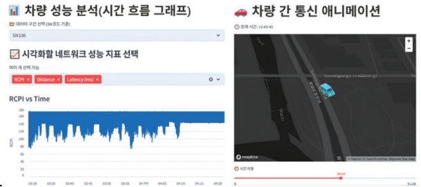
그림 3 (좌)시각화 대시보드 일부, (우)차량 통신 애니메이션

흐름에 따른 차량 간 통신 상태를 동적으로 표현하는 애니메이션 기능을 구현하여, 특정 시점에서의 급락·지연 뿐만 아니라 구간 전체에서 반복되는 품질 저하 패턴을 직관적으로 확인할 수 있도록 하였다. 지도 상에서는 차량 경로를 따라 통신 링크의 색상이 시간에 따라 변하며, 통신 상태가 실시간으로 변화하는 모습을 시각적으로 보여준다