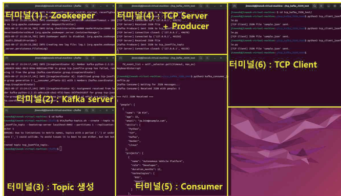
그림 2. 터미널을 통한 시스템 구성 요소 실행 및 동작 확인 화면

본 연구에서는 먼저 OAI 네트워크 내에서 TCP 서버와 클라이언트를 구성하였다. TCP 클라이언트는 주기적으로 데이터를 생성하고 이를 kafka 프로듀서를 통해 지정된 topic과 파티션으로 송신하였다. kafka 컨슈머는 송신된 데이터를 구독하여 수신함으로써 데이터 전송의 정상성을 확인하였다. 실험에서는 단순 텍스트 데이터뿐만 아니라 이미지 파일과 외부 네트워크를 통한 데이터 수신에 정상성도 확인하였다. 또한, zookeeper와 kafka server, topic을 각 터미널에서 실행하며 로그를 분석함으로써 TCP 연결 상태, 데이터 전송 상태, 그리고 시스템 전체의 안정성을 종합적으로 평가하였다.