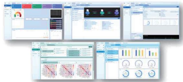
〈그림 2〉 지능형 자기지도학습 모델관리 프레임워크 개발 예시

<그림2>는 진술한 지능형 자기지도학습 모델관리 프레임워크의 개발 결과물 예시로, 지능형 자기지도학습 모델관리 프레임워크를 통해 학습 데이터를 구성하고, 데이터 증강과 자기지도학습을 통한 모델을 생성하여, 실험환경에서 수집된 네트워크 데이터 적용을 통해 침해위협 탐지 기능을 시험하였다.