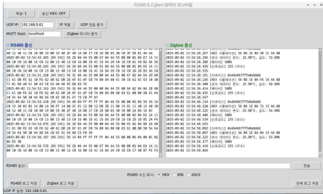
그림 2 로컬 통합 허브에 수신된 RS485 데이터(좌) 와 온습도 데이터(우)

Zigbee 경로에서는 Zigbee2MQTT 기반의 토크 구독을 통해 실제 온도, 습도, 배터리, 링크품질과 같은 구조화된 JSON 페이로드를 수집한다. 그림 2와 같이 로컬 통합 허브에서 Zigbee 온습도 센서의 실제 환경 측정 데이터와 RS485 데이터를 동시에 수집 및 통합하는 것에서 출발한다.