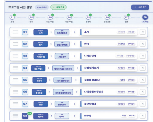
[그림 2] 인문 감정치유 프로그램 구성 방법 예시