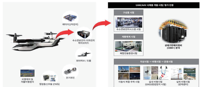
<그림 1> UAM 핵심부품 성능시험 체계 구성

UAM 핵심부품의 성능 및 신뢰성 시험평가를 통해 인증함으로써, 기체의 안전성 및 신뢰성을 확보할 수 있다. UAM 핵심부품 성능시험 체계 구성은 <그림 1>과 같다.